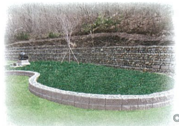
◎樹林葬(自然葬)のイメージ

継承者が不在となっても霊園が責任をもってお墓を見守ります。また万一の場合「永代供養塔(合葬墓)」「樹林葬(自然葬)」への改葬を保障する画期的なプランです。もう「墓じまい」の心配もいりません。